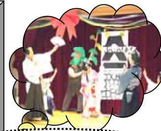
「ぽぽハッピーまつり」より