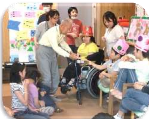
“はばたき”の子ども達はおとなりのおじいちゃんおばあちゃんと仲良くお誕生日会です