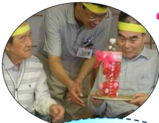
ミニ運動会で 軽くからだを動かして。