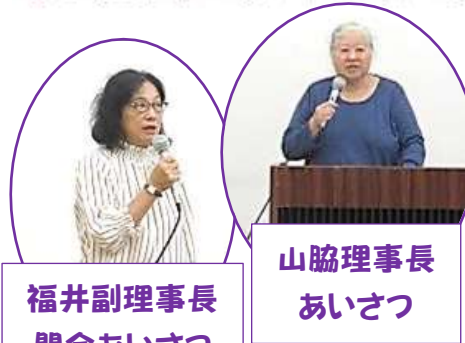
福井副理事長 開会あいさつ