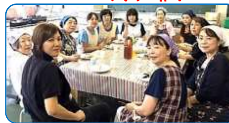
ボランティアの底力!!