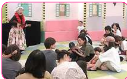
人形劇「かにこぞうさん」