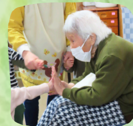
保育園児との交流