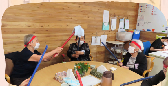
みんなで力を合わせて楽しむ