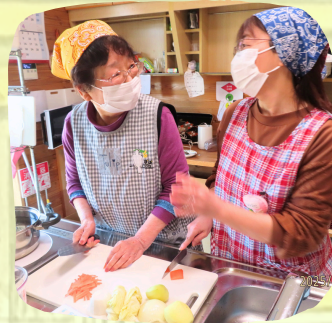
生活リハビリ（調理）