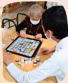
年齢を超えて楽しくゲーム