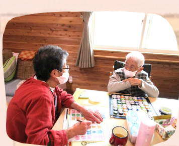
楽しい会話でリラックス

一人一人に笑顔と感謝の気持ちで接し、 その方に応じたあたたかい自立支援を 実践しています。