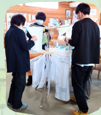
一緒にお洗濯干し