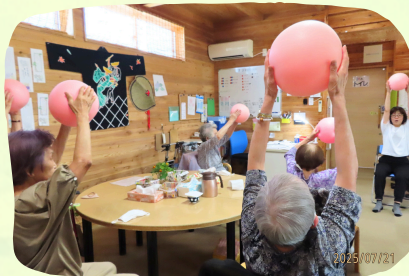
ボールを使って体操