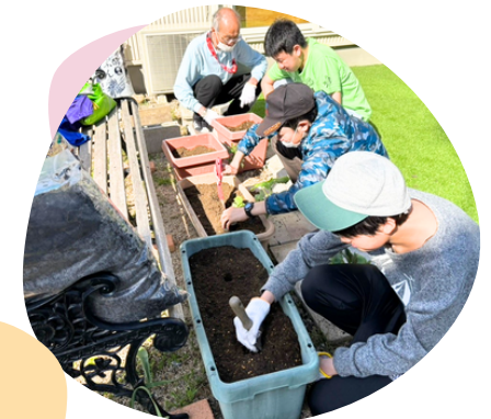
土の感触さやって学ぶ！