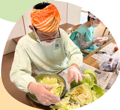
調理するって楽しいな！