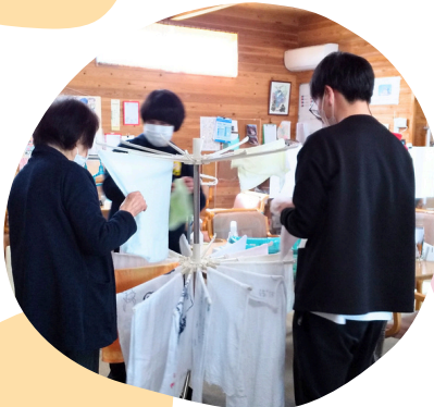
タオル干しのお手伝い お家でもできるかな？