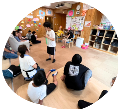
朝の会・帰りの会では 自主性を育てます。