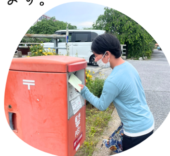
お散歩がてらにお手紙だし♪