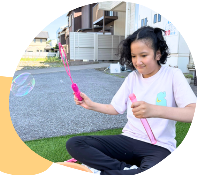
ふわふわシャボン玉でリラックス