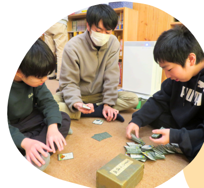
遊びの中でルールを学ぶ