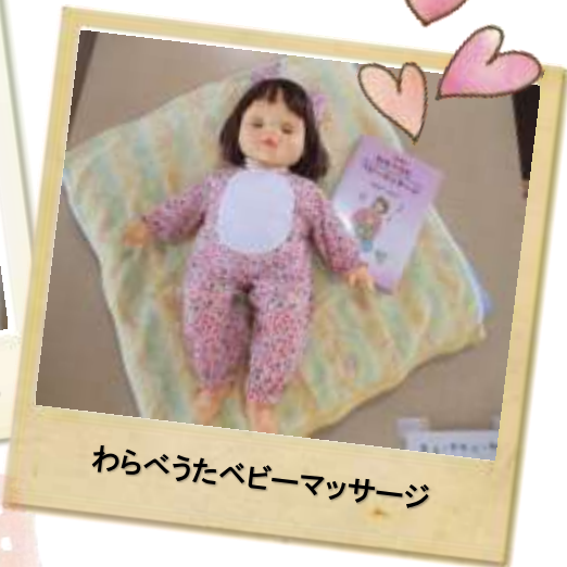
わらべうたベビーマッサージ

赤ちゃんとのふれあい ママ同士の交流、赤ちゃん 同士のかわいい交流を楽し みましょう!