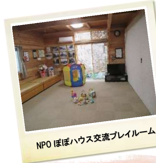
NPO ぽぽハウス交流プレイルーム