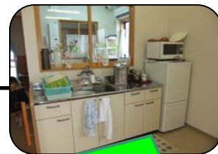
簡単な調理もできるキッチンスペース。 IHコンロもあります。