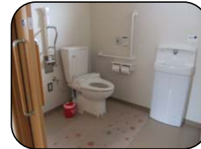
車イスごと個室に入れる バリアフリートイレ。