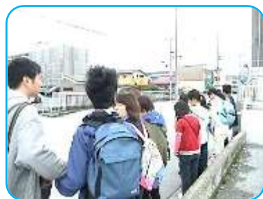
バス早く来ないかな～?