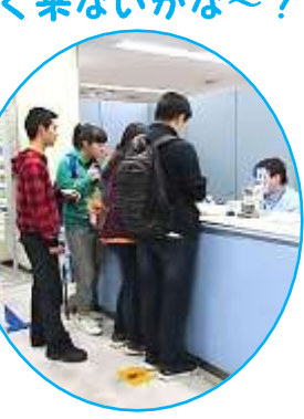
JRの駅で切符を買います!!